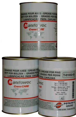
T-61032-05, 1 kg