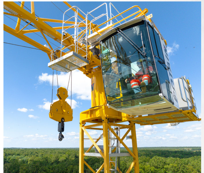
SM/DM Quick Lock™